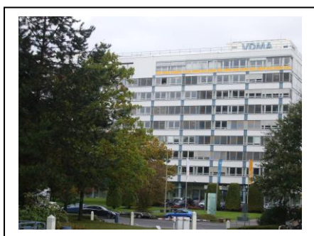
ISO/TC131フランクフルト国際会議場