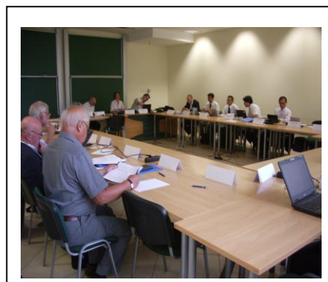
ISO/TC131/SC7/WG3ヴロツワフ国際会議