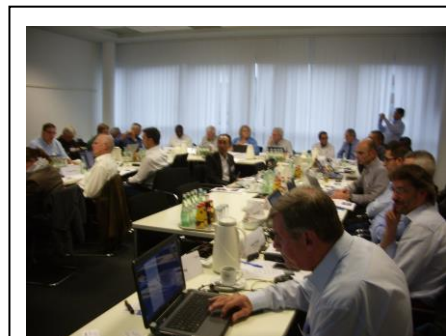
ISO/TC131/SC6フランクフルト国際会議